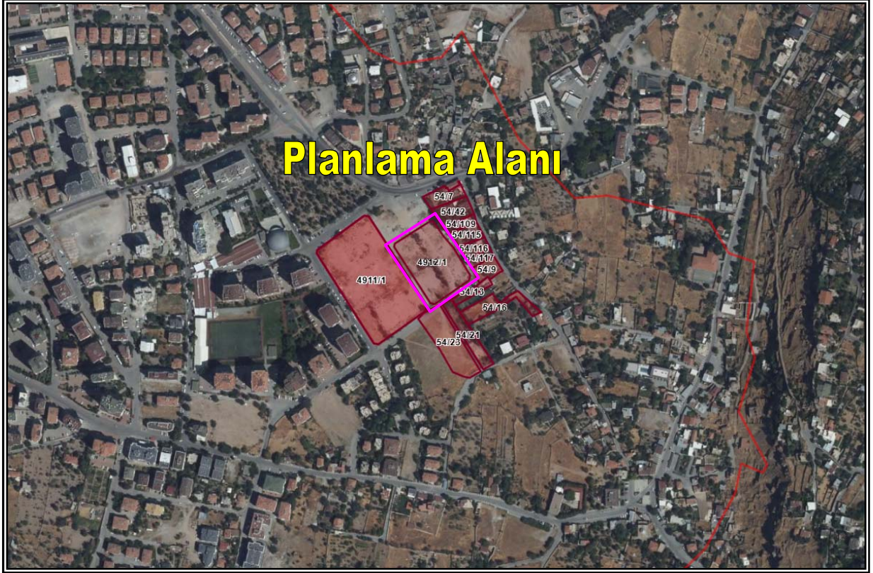
Resim 4: Planlama Alanı Mülkiyet Durumu