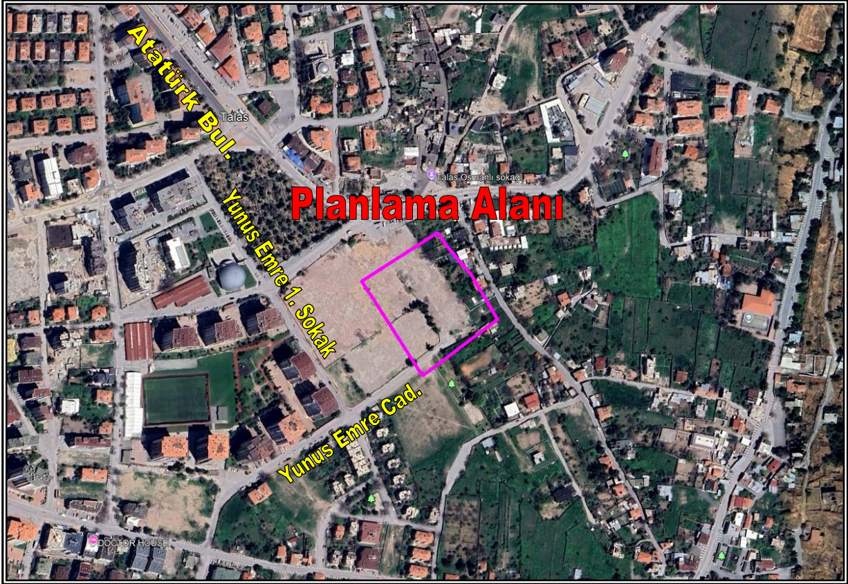
Resim 1: Planlama Alanının Konumu

Planlama alanı; düz bir arazi yapısına sahiptir. Bahse konu alan üzerinde herhangi bir yapılaşma görülmemiş olup boş arazi statüsündedir. Planlama alanının yakın çevresinde 2-3 katlı konut kullanımlı yapılar, sosyal altyapı tesisleri ve boş araziler yer almaktadır.